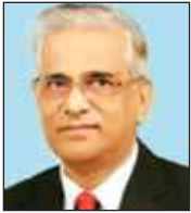
ড. শামসুল আলম প্রতিমন্ত্রী, পরিকল্পনা মন্ত্রণালয় ও আওয়ামী লীগের উপদেষ্টামণ্ডলীর সদস্য

অর্থনৈতিক রূপান্তর হলো এমন একটি প্রক্রিয়া যার ফলে একটি অর্থনৈতিক পদ্ধতি থেকে আরো উৎপাদনশীল পদ্ধতিতে পরিবর্তন ঘটে। উন্নয়ন ধারায় সাধারণত এ রূপান্তরের মাধ্যমে কৃষিপ্রধান অর্থনীতি থেকে ধীরে ধীরে প্রথমে শিল্প ও ক্রমান্বয়ে সেবাভিত্তিক অর্থনীতিতে পরিবর্তিত হয়। এর মাধ্যমে দুটি জিনিস ঘটে। একটি হলো উৎপাদনশীলতা বৃদ্ধি ও প্রযুক্তিগত উৎকর্ষ। এ রূপান্তরের অনেকগুলো কারণ রয়েছে। তার মধ্যে উল্লেখযোগ্য হলো প্রযুক্তির উদ্ভাবন, মানবসম্পদ উন্নয়নে সরকারি নীতি এবং বিশ্বায়নের ফলে উদ্ভূত বাড়তি প্রভাব অর্থনীতিকে গতিশীল করে। এর ফলে অর্থনৈতিক অগ্রগতি ত্বরান্বিত হয় এবং মানুষের জীবনযাত্রার উন্নতি হয়। ঊনবিংশ শতাব্দীতে শিল্প বিপ্লবের ফলে অনেক দেশ কৃষিপ্রধান থেকে শিল্পভিত্তিক অর্থনীতিতে পরিণত হয়। অর্থনৈতিক রূপান্তর বেশ জটিল সমন্বিত প্রক্রিয়া এবং এর সফলতা নির্ভর করে সমাজস্থিতির জন্য রাজনৈতিক স্থিতিশীলতা, পুঁজির সহজগম্যতা, মানব উন্নয়ন এবং পরিবর্তিত পরিস্থিতির সঙ্গে মানিয়ে নেয়ার ওপর। বাংলাদেশে বিশেষভাবে গত দেড়